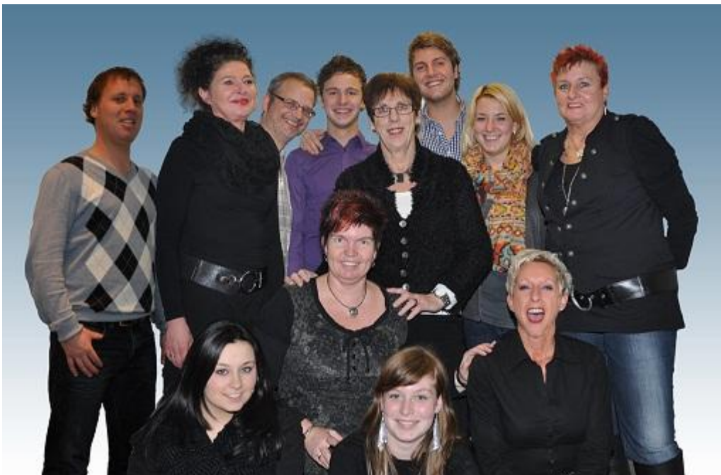
Beleefd uitnodigend “Tonieëlgroep Bèngelder”

Een gebed vol kolder met een verrassend eind.